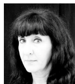
Ceu Guarda VOGAL