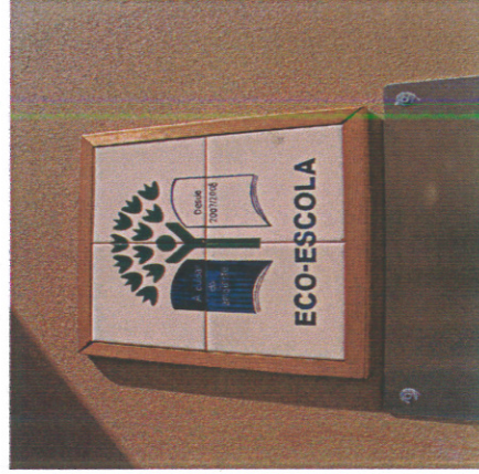
Painel de Azulejo oferecido à escola como reconhecimento do trabalho feito em prol do ambiente

Escola a Escola Pró-Ambiente” é um programa de educação e sensibilização ambiental com o objetivo de sensibilizar os alunos para a sustentabilidade ambiental nas suas diferentes dimensões. É orientado pela Câmara Municipal de Lisboa e a oferta educativa propõe um conjunto integrado de atividades que incluem, entre outras, visitas de estudo, jogos e concursos, organizadas em torno de várias temáticas ambientais, exploradas a partir de metodologias ativas.