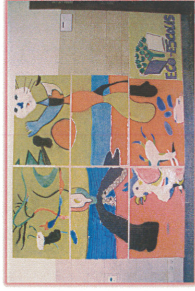
Exposição e cartazes elaborados nos dias Eco-Escolas